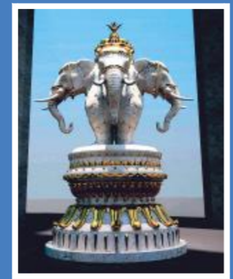
本刊物所述内容及效果图为对梅川路改造的设计方案,在改造过程中根据实际情况可能会有所调整,最终以实际呈现实物为准

放置在“祥和之光”底部的四面象雕塑设计为四神像背负丰收果盆。在中国文化里,“象”与“祥”谐音,“盆”与“平”谐音,寓意为“祥和平安”。且象五行属金,自古被赋予了吉祥和聚财的寓意。